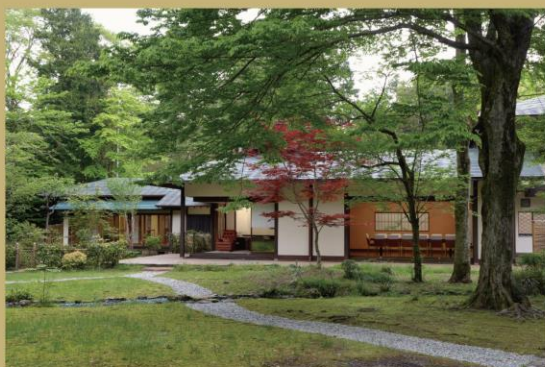
東山旧岸邸：庭園で能を鑑賞 雨天時は一部テントを設営致します