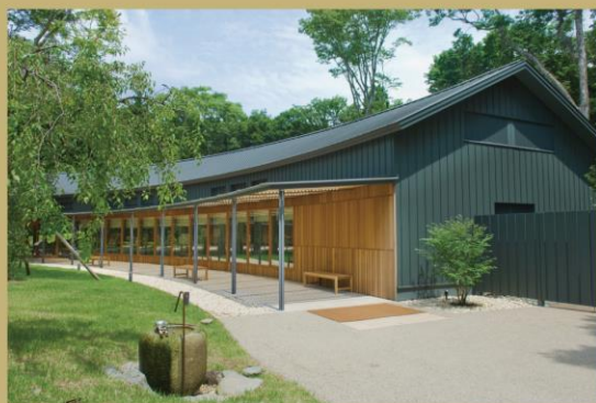
とらや工房：特製菓子製作・食事会場提供