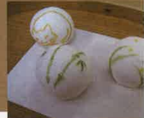
とらや工房特製和菓子にオリジナル絵つけ。